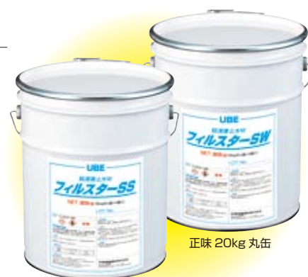
正味 20kg 丸缶