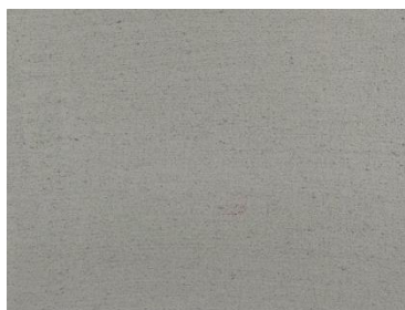
U-エルシーフィニッシュ塗布コンクリート