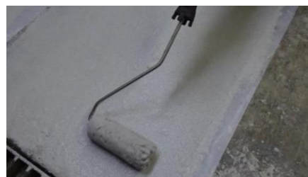
ローラーによる施工