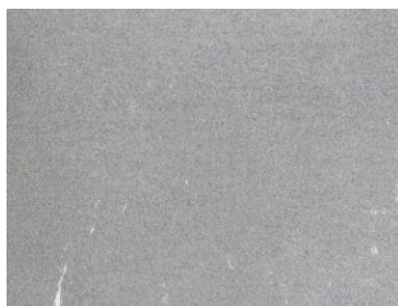
U-エルシーフィニッシュCL塗布コンクリート