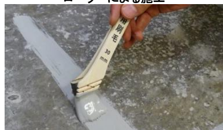
刷毛による塗布(小面積)