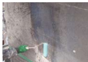
ダレが少なくローラー施工による1回塗りが可能